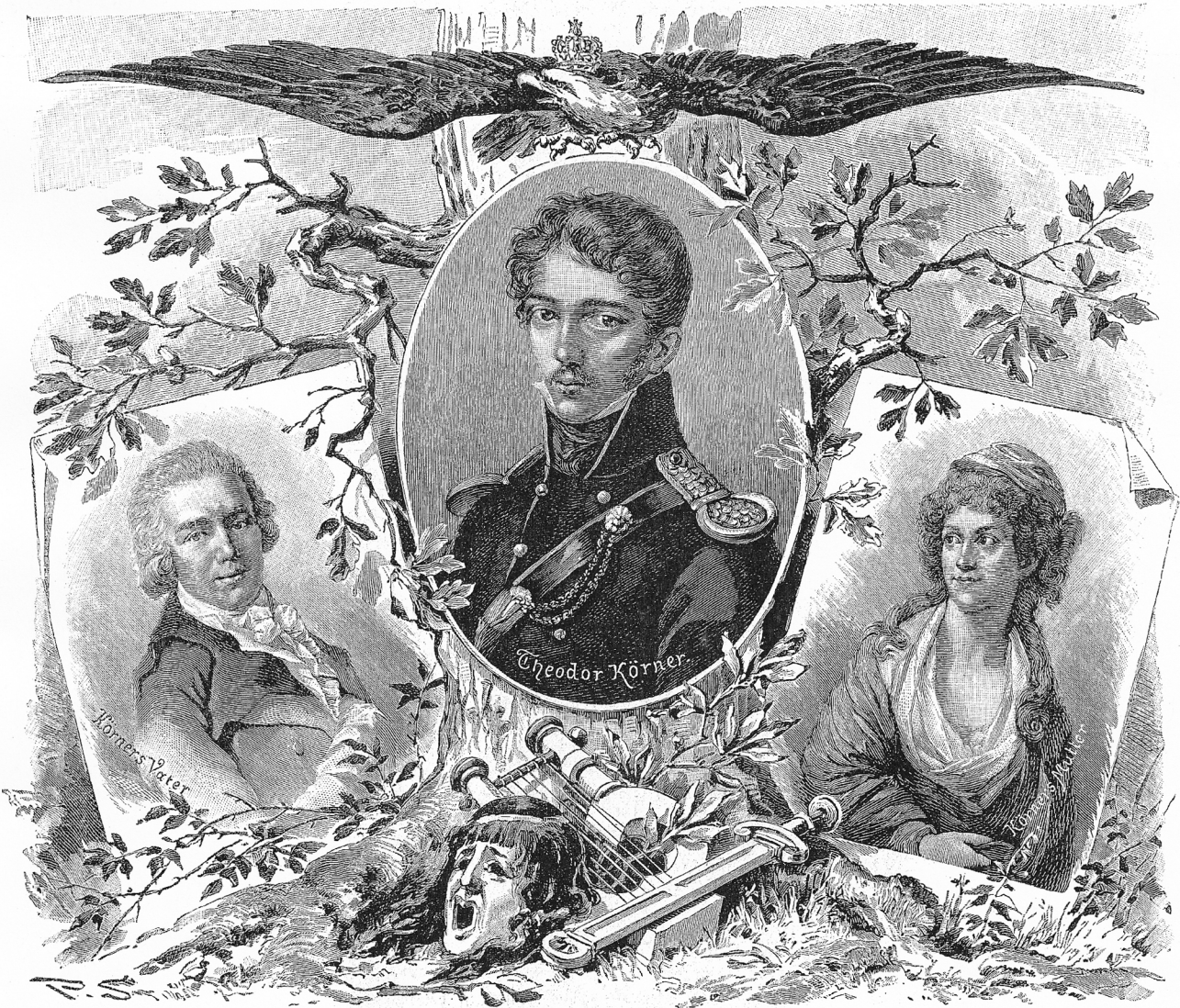
Zu Theodor Körners hundertjährigem Geburtstage.

In Wochen-Nummern vierteljährlich 1 Mark 60 Pf. In Halbheften: jährlich 28 Halbhefte à 25 Pf. In Heften: jährlich 14 Hefte à 50 Pf.