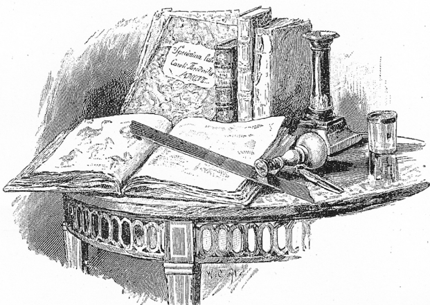
Reliquien aus Körners Schul- und Studienzeit.