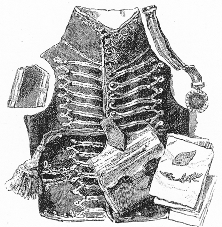
Reliquien aus Körners letzten Tagen (Achselkapsen, Uhrband, Säbelkoppel, Uniformweste, Taschenuhr).