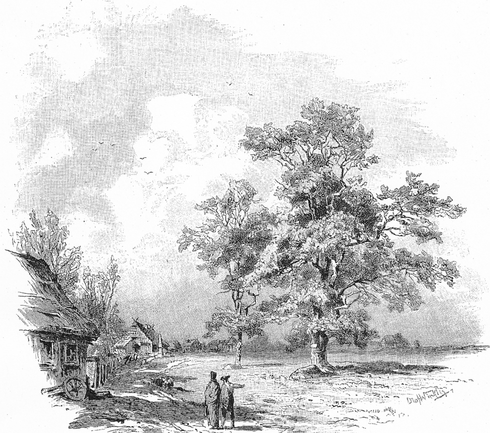
Körners Grabstätte bei Wöbbselin im Jahre 1813. Nach einer Zeichnung von Olof Winkler.

Jurantisch seines „Briny“ prophetisch selbst gezeichnet, wenn dieser ausruft: